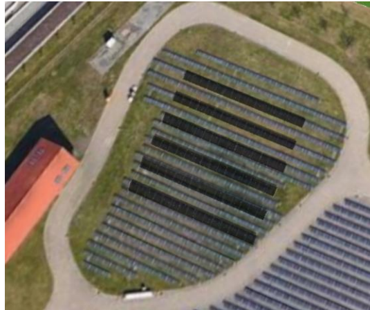
Abbildung 1: 99-kWp-PV-Freiflächenanlage als Simulationsgrundlage

Für diese Anlage wurden zwei Lastgänge ermittelt: zum einen auf Basis der in PV*SOL hinterlegten, gemittelten Wetterdaten für Rostock aus dem Zeitraum 1992 bis 2012 und zum anderen auf Basis der spezifischen Wetterdaten aus dem Jahr 2025.