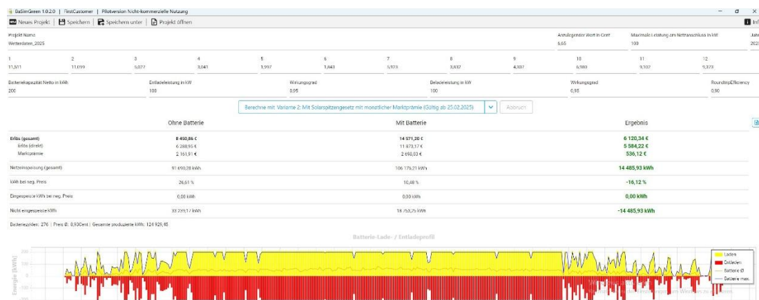
Abbildung 2: Ergebnis Simulation mit spezifischen Wetterdaten

Grundsätzlich lieferte der Lastgang mit den gemittelten Wetterdaten einen etwas geringeren Jahresertrag als mit den spezifischen Wetterdaten.