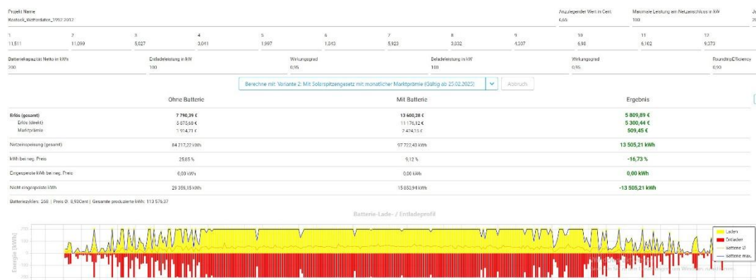
Abbildung 1: Ergebnis Simulation mit gemittelten Wetterdaten